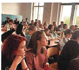
Besedu s ostrovskými hasiči dneš absolvovali žáci třetích ročníků